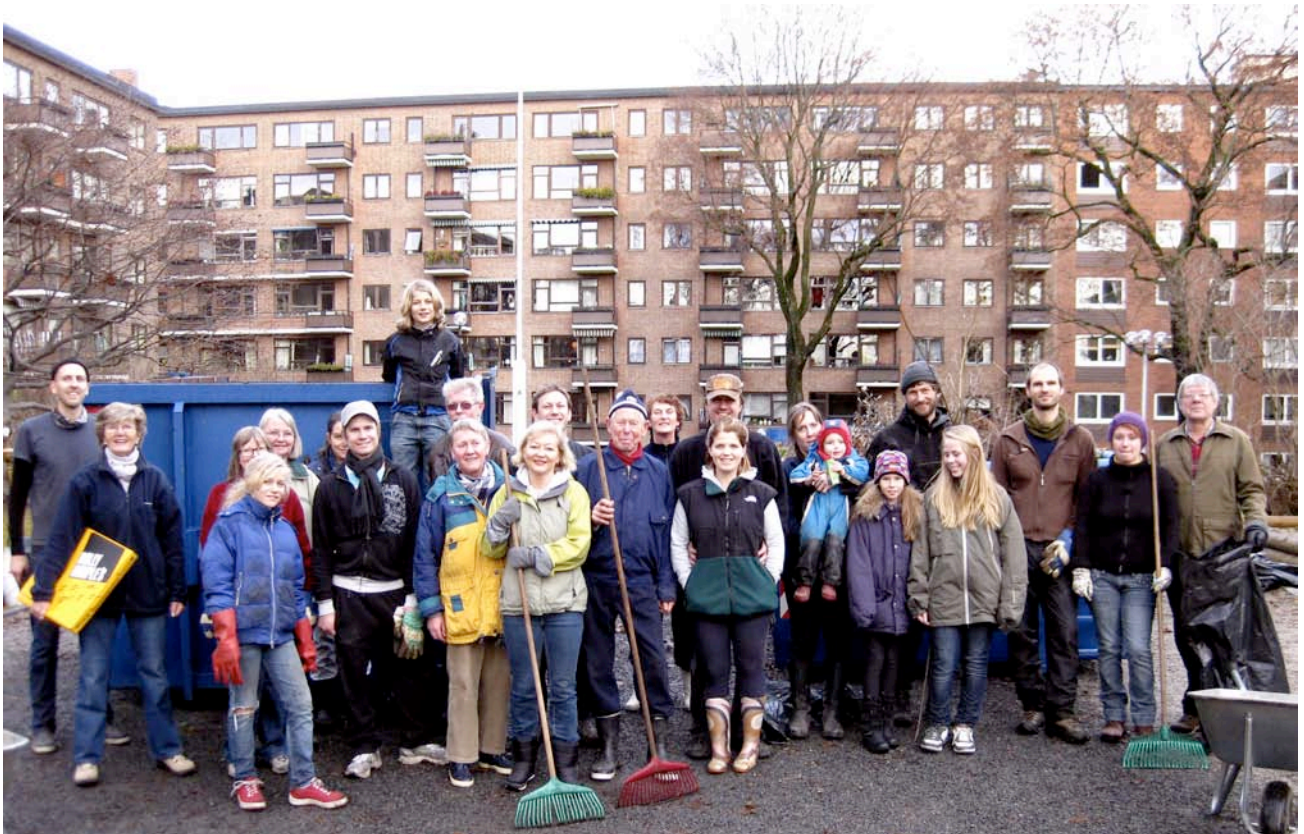
En samlet dugnadsgjeng etter endt dont. Styret sørget for pizza til alle!