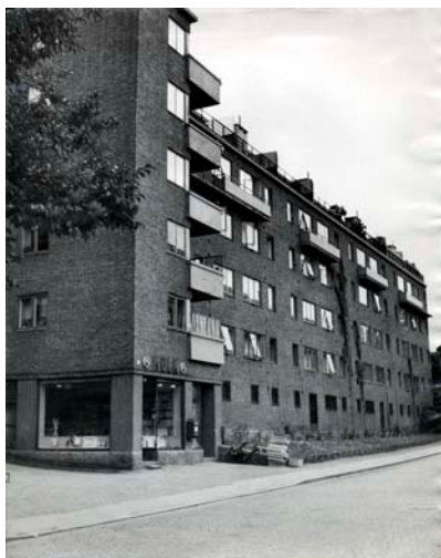
Melkebakken på 30-tallet

Balkeby hadde en profilert styreformann fra 1938 til langt ut på 50-tallet som huskes godt. Spesielt sjarmerende er det å tenke på at han gikk rundt til alle beboerne og delte ut appelsiner og overskudd i kontanter når regnskapet var gjort opp. Styremøtene holdt de hjemme i leilighetene til styremedlemmene, men det huskes også at det rommet i Industrigaten som i dag er redskapsrom, ble brukt til å holde styremøter. Generalforsamlingene ble etterhvert holdt i forsamlingslokalet i kjelleren på bankfunksjonærenes hus, når dette ble bygget i Industrigaten 30 på begynnelsen av 60-tallet. Her ble forøvrig NRKs fjernsynsteateret i mange år spilt inn, worldmusic cafeen Cosmopolite hadde deretter lokaler der og i dag er det den populære thai restauranten YaYas som ligger der.