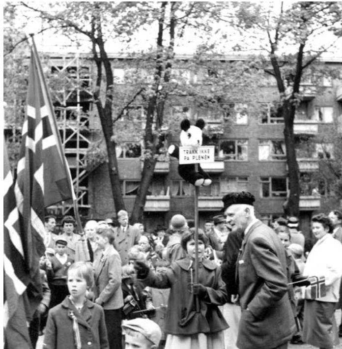
Styreformann og fanebærer i konferanse

veisløyfen frem til omtrent der hellene går over plenen i dag. Her slo de ball, kastet på stikka, lekte «høl i hatten», og om vinteren ble plassen sprøytet så de fikk skøyteis. På plenen, det